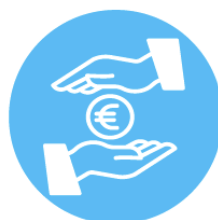
Licence Économie ( à venir )