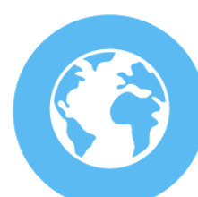
Licence Géographie ( à venir )